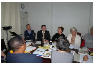
Sitzung bei Lebensort Vielfalt